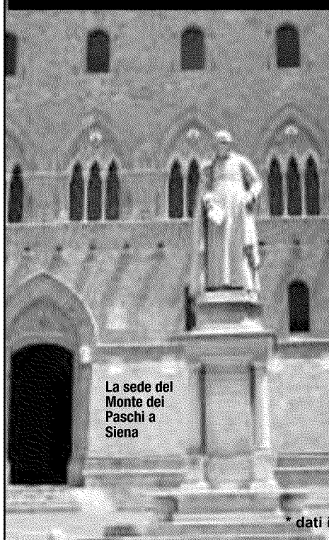
La sede del Monte dei Paschi a Siena